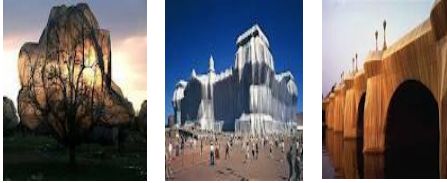
Christo et Jeanne Claude