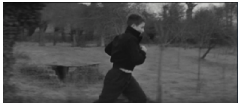
Les Quatre Cents Coups de François Truffaut, 1959