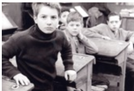
Les Quatre Cents Coups