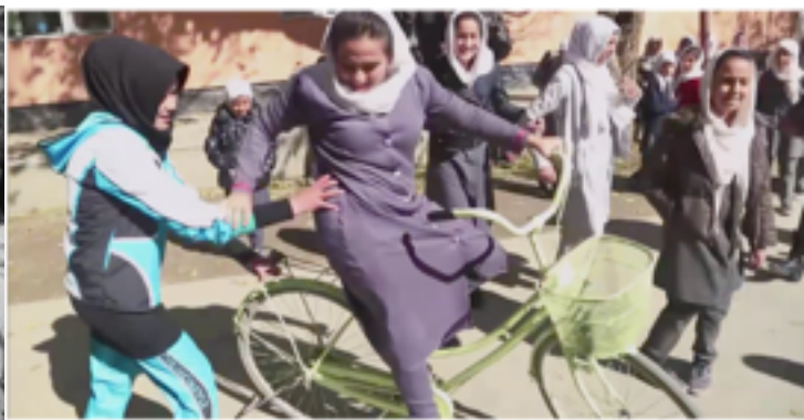
Les petites reines de Kaboul, Arte, 2016