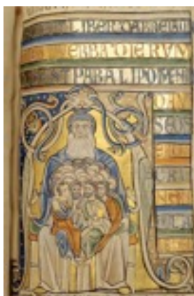
Abraham, bible de Souvigny, XII e