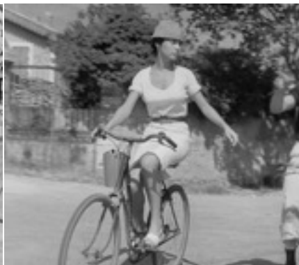
Les Mistons de François Truffaut, 1958