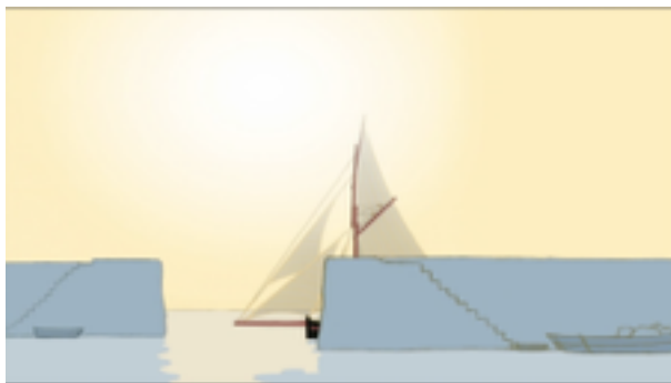
L'île de Black Mor de Jean-François Laguionie, 2003

- Collège au cinéma : dossier 217 http://www.cnc.fr/web/fr/college-au-cinema1/-/ressources/6180860