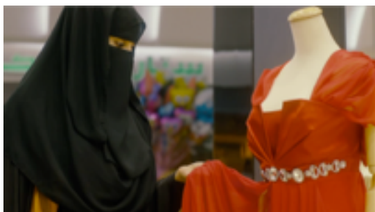
Thames & Hudson, 2009

« Le vert s'est vu attribuer une valeur symbolique dans un contexte très différent. La plupart des drapeaux modernes qui contiennent du vert appartiennent à des pays musulmans : la tradition rapporte que le manteau et la bannière de Mahomet étaient verts, et selon le Coran ( XVIII,31 ; LXXVI, 21), les bienheureux au Paradis devaient porter des robes de soie vertes. »