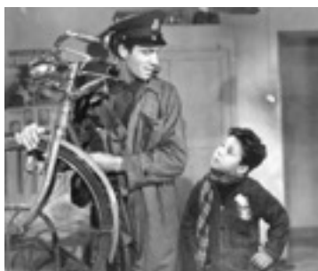
Le Voleur de Bicyclette