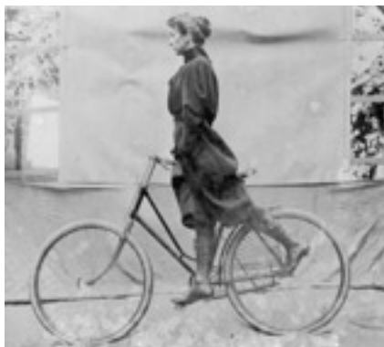
Wheeling d'Alice Austen, 1896

Clarence Rodriguez, Révolution sous le voile , First document, 2014