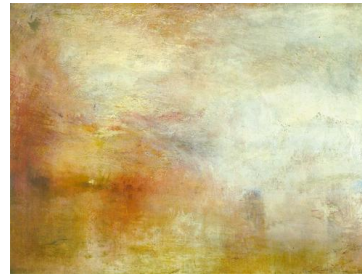
Lever de soleil sur un lac, William Turner, 1840